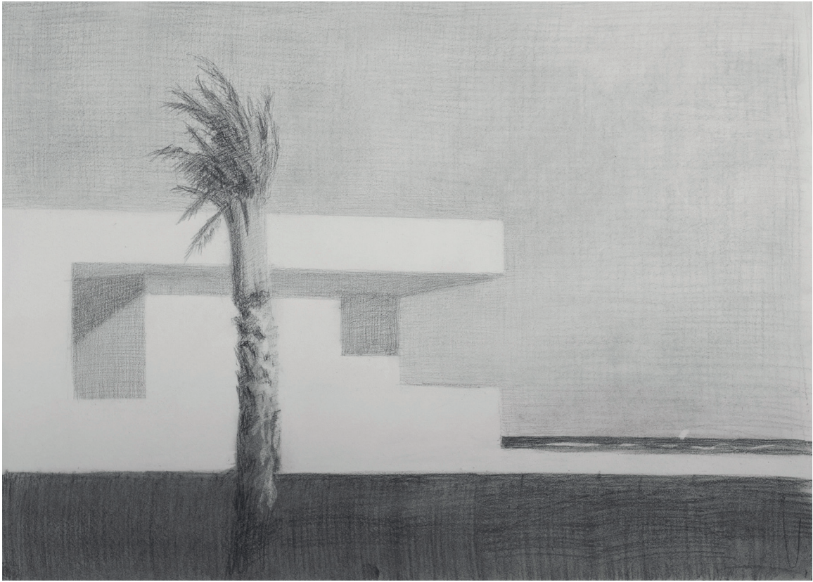
Marcelo Fuentes Apartamentos 4 2019