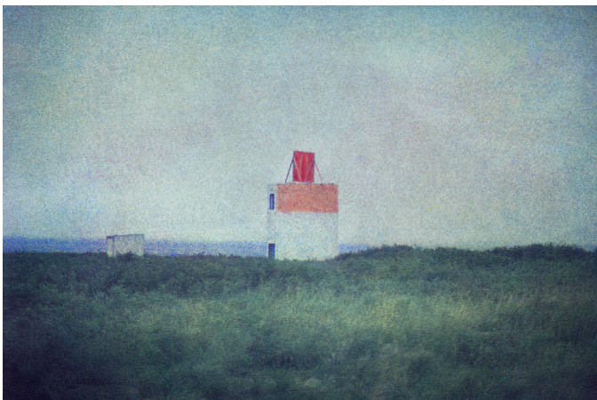
Bernard Plossu Ile de Molène 2008