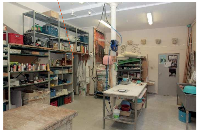
Salle de production