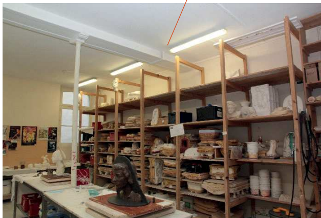
Dernières retouches !!!