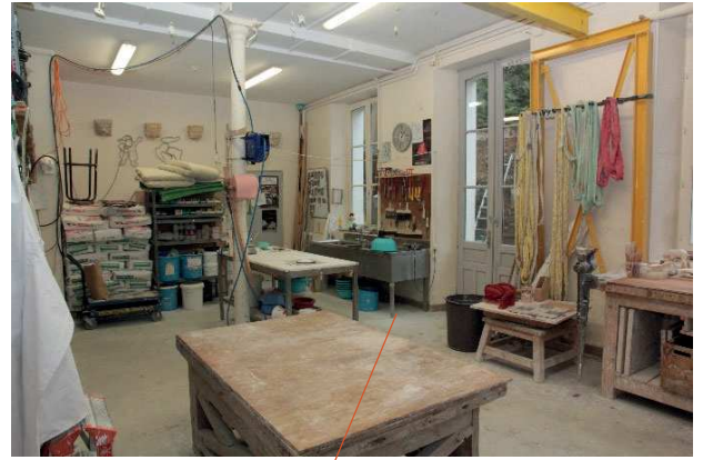
Salle de production