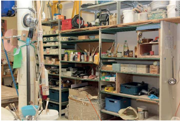
La boîte à outil